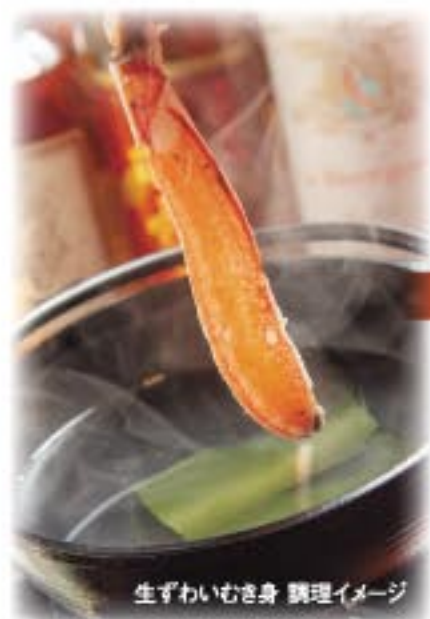
生ずわいむき身 調理イメージ